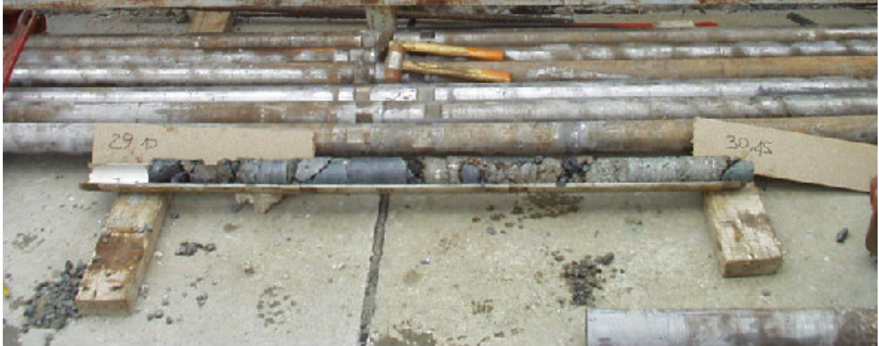
Confronto tra campioni prelevati con carotiere T6S (sopra) e carotiere T6 “Triplex” Comparison between T6S (up here) and T6 “Triplex” samples