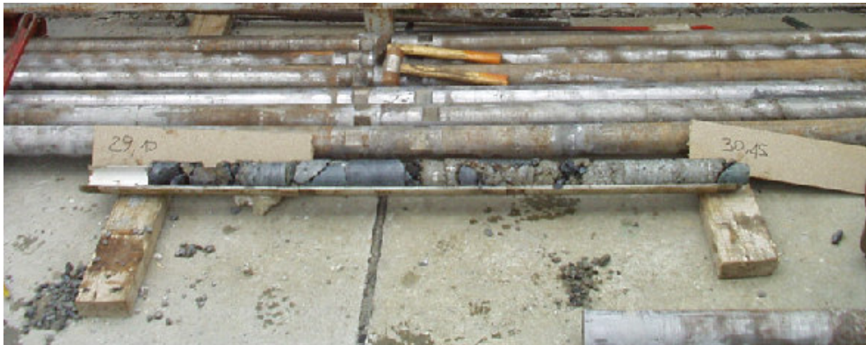
Confronto tra campioni prelevati con carotiere T6S (sopra) e carotiere T6 “Triplex” Comparison between T6S (up here) and T6 “Triplex” samples